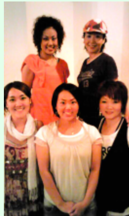
第三場 Guest Dancer