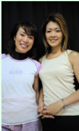
第七場 Guest Dancer